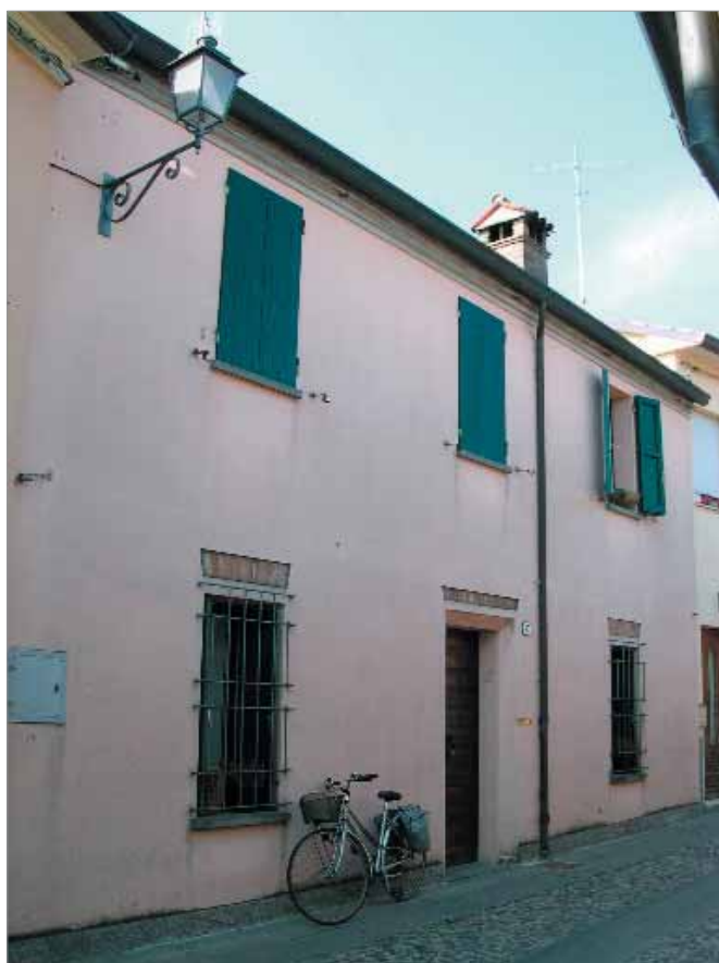
Via Verdi 43 Fronte Principale